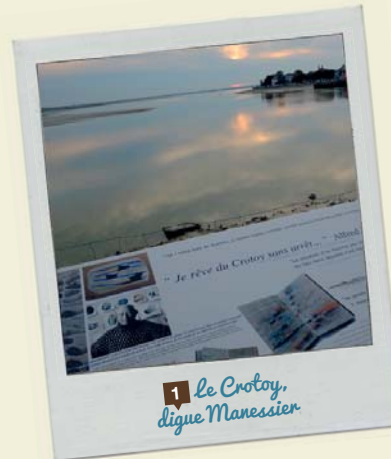
1 le Crotay, digue Manessier