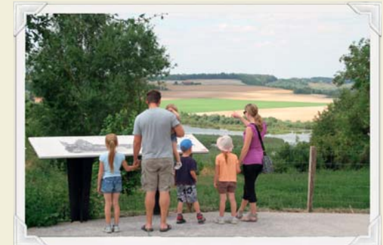
Des belvédères à partager en famille