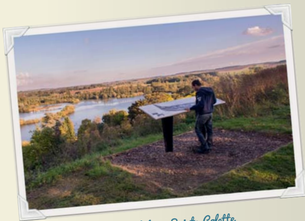
10 Corbie, falaise Sainte-Colette