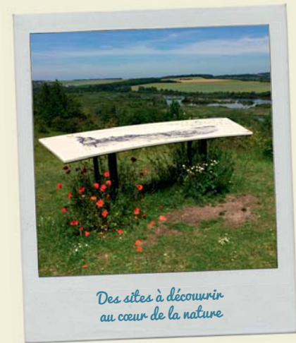
Des sites à découvrir au cœur de la nature