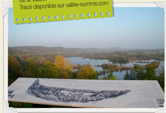
Une invitation au voyage