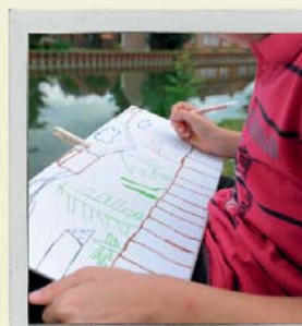
Des outils pour apprendre à regarder le paysage