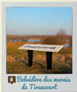
8 Belvédère des marais de Tirancourt