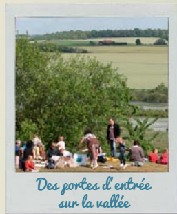
Des portes d'entrée sur la vallée