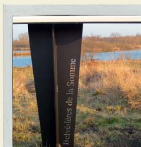
Un réseau de sites à découvrir tout au long de la vallée