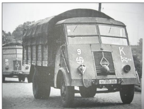
Les camions allemands qui stationnaient dans la ferme Boulnois

C'est au printemps 1943 que le maire fut avisé qu'il y aurait incessamment l'installation d'un cantonnement dans le village. Quelques jours plus tard une unité médicale vint visiter l'école et apposa des bandes blanches autour des portes et des fenêtres pour pouvoir désinfecter ensuite disait-on. Les Allemands s'installèrent peu de temps après, qui dans l'école, qui dans des maisons vides, qui chez l'habitant. Le village s'était transformé sans heurts et quelques sentinelles étaient apparues aux endroits jugés importants : on ne sait jamais ! Aux dires des gens du village la crainte légitime suscitée par les nouveaux arrivants se transforma vite en une prudente observation puis en rapports corrects. La vie reprit son cours. La présence allemande était visible mais discrète.